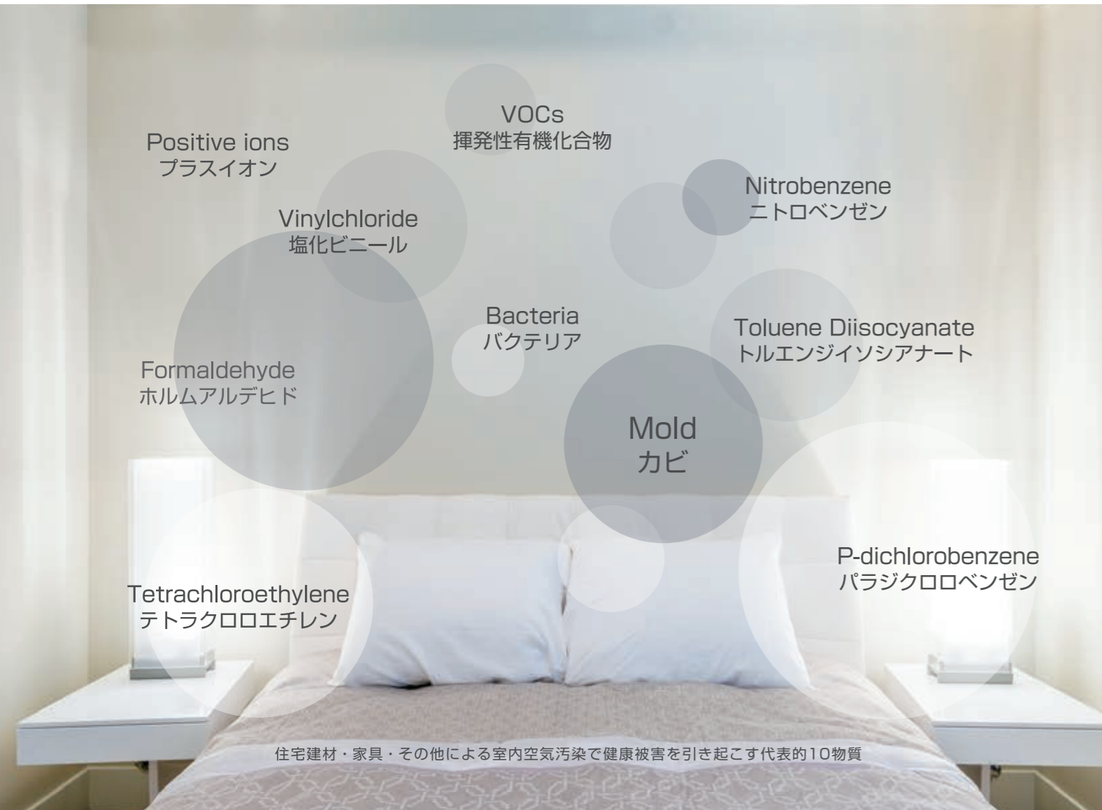
住宅建材・家具・その他による室内空気汚染で健康被害を引き起こす代表的10物質

喘息、アトピー性皮膚炎、アレルギー性鼻炎などの様々なアレルギー。化学物質過敏症などの健康被害の多くは、壁や床に使われている化学樹脂系の建材に原因があると言われています。