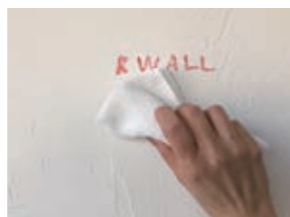
濡れタオルで拭き取るだけ

クリーム状で伸びがよく、軽量なのでコテさばきが ラクでスピーディーな作業が可能です。 粉を液体と混ぜて使用する手間がなく、ほこりも 立たず作業が清潔で効率的です。柔軟性があるの で曲げや割れにも強く、補修も簡単にできます。