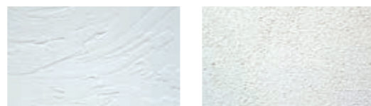
コテ塗り (ベネチアンウェーブ)

高級感のある「コテ塗り」、シンプルな「ローラー塗り」 お好みに応じた室内が生まれます。